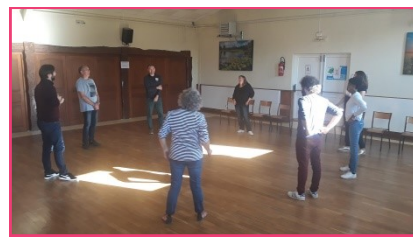
INITIATION AU THÉÂTRE AVEC LA COMPAGNIE LOGOS

4 ateliers ont été proposés à la cinquantaine de participants présents pour leur permettre d'oser s'exprimer de différentes manières en fonction de leur sensibilité ou de leur envie.