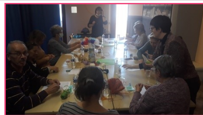
CREATION D'ATTRAPES RÊVES AVEC LES ADMINISTRATEURS BENEVOLES