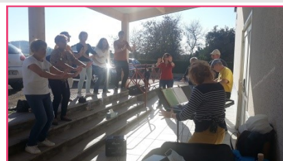
OSER SA VOIX AVEC LA CHEFFE DE CHŒUR DE LA CHORALE AGUASONG